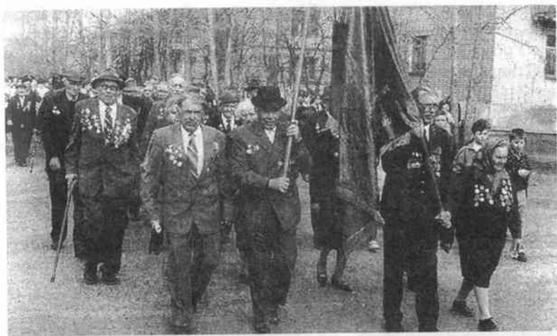
Ветераны Отечественной войны села Кетово в День 50-летия Победы